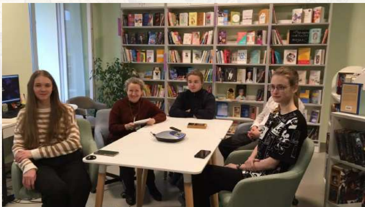
Книжный клуб «Литературная среда»

Если вы хотите говорить о книгах, обсуждать их или заметили, что стали меньше читать, у нас для вас есть рецепт! Приходите в книжные клубы Сланцевской библиотеки! Что получится? А получится сообщество любителей книги.