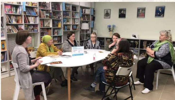
Книжный клуб «12»