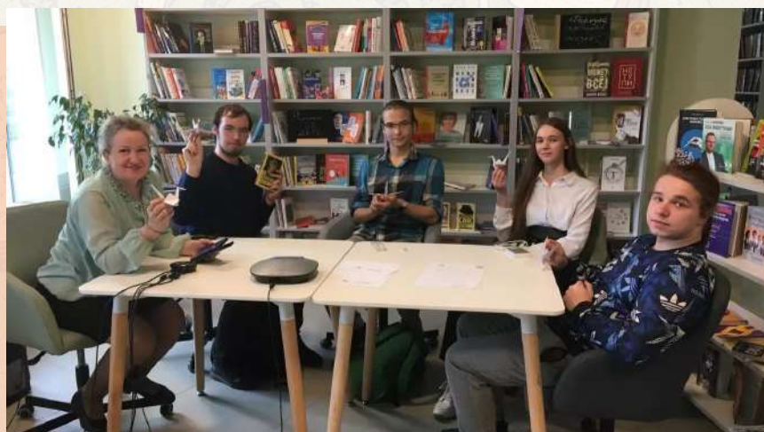
На встрече молодёжного книжного клуба «Литературная среда». Отсканировав QR-код, вы сможете посмотреть короткое видео