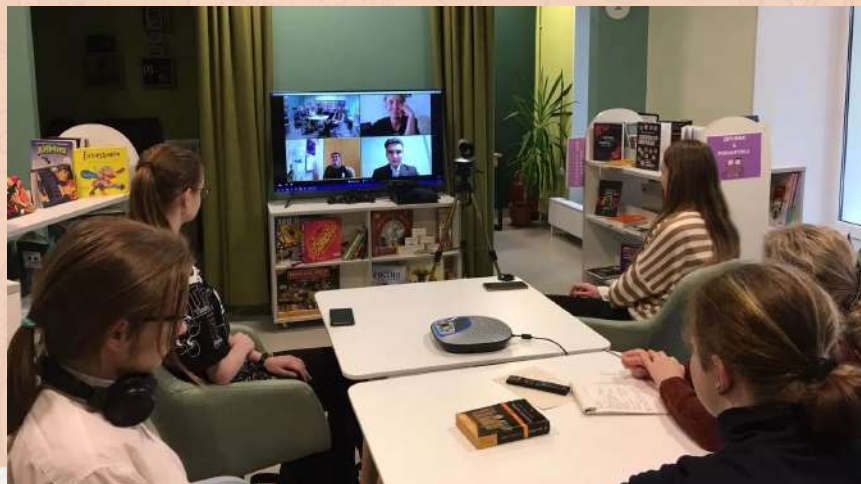
На встрече молодёжного книжного клуба «Литературная среда». Отсканировав QR-код, вы сможете посмотреть короткое видео